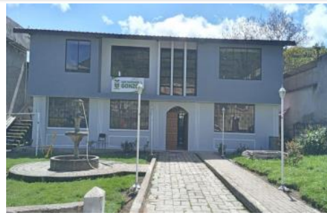
Construcción de la Segunda Planta GADPRG, Primera I