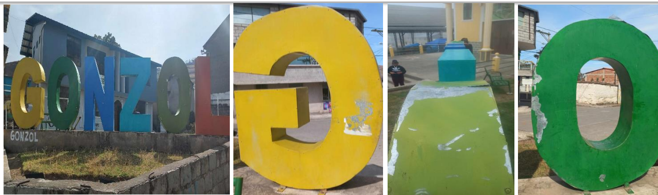
Deterioro de las letras Gonzol que se encuentra en las instalaciones del Gad