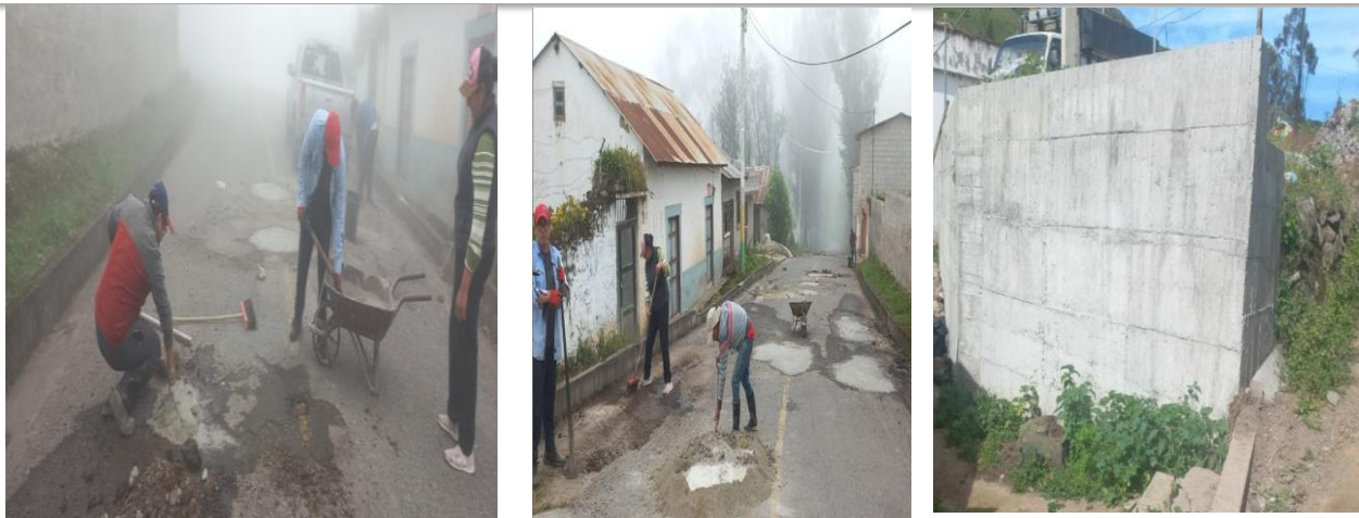
Bacheos- Cabecera Parroquial, muro de contención-Comunidad de Zúnag

En el componente Asentamientos Humanos el GADPR Gonzol ha invertido un monto global de USD $23.390,03