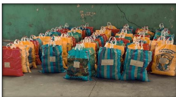
Entrega de kits de alimentos de primera necesidad Cabecera Parroquial y Comunidad de Cochapamba