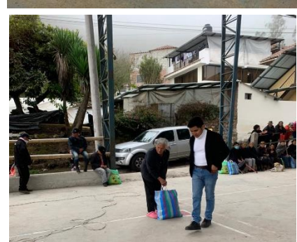
Entrega de kits de alimentos de primera necesidad Comunidad Zúnag, Iltús y San Martín