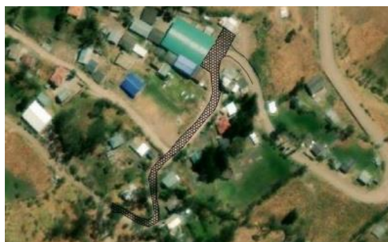
Adquisición de adoquín para la comunidad de Iltus Administración 2019-2023