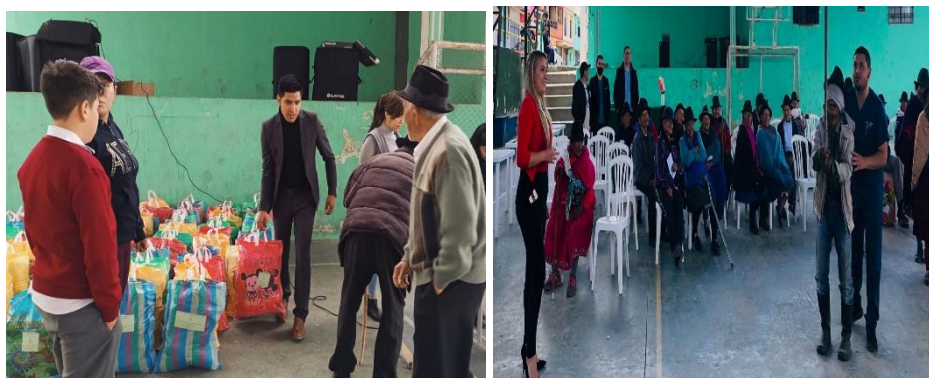
Mismos equipos que han sido de apoyo para los diferentes eventos programados por el Gad