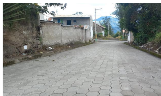
Readoquinado de la calle 12 de Octubre por la época invernal