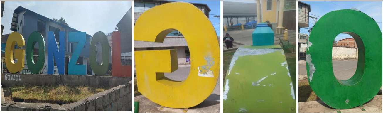
Deterioro de las letras Gonzol que se encuentra en las instalaciones del Gad