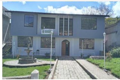
Construcción de la Segunda Planta GADPRG, Primera I