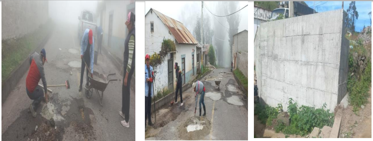
Bacheos- Cabecera Parroquial, muro de contención-Comunidad de Zúnag

En el componente Asentamientos Humanos el GADPR Gonzol ha invertido un monto global de USD $23.390,03