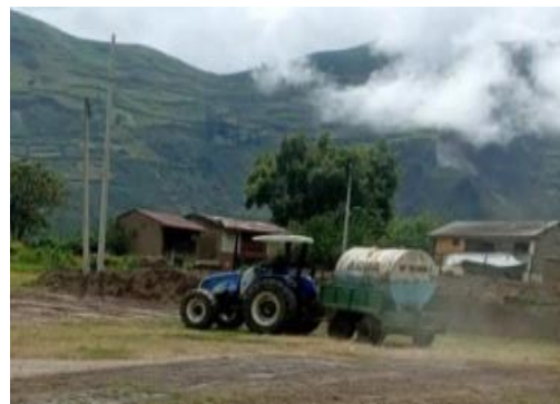
Tractor agrícola en trabajos comunitarios