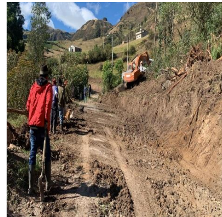
Contratación de una retroexcavadora oruga mantenimiento correctivo y preventivo