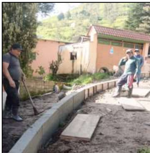
Fotografía 02: Adoquinado en la Comunidad Iltús