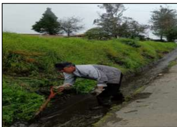
Fotografía 01: Servicios Generales

En el Sistema Físico Ambiental del GADPR Gonzol se ha invertido un monto global de USD $7.947,01 .