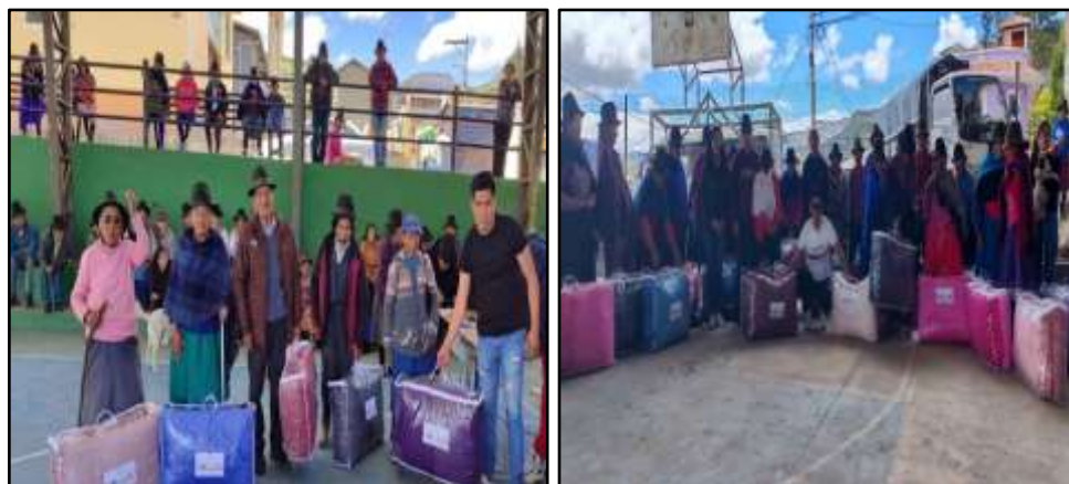
Fotografía 07: Entrega de cobertores ovejeros