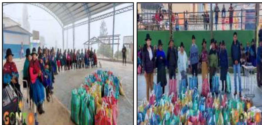
Fotografía 08: Entrega de las canastas de alimentos de primera necesidad