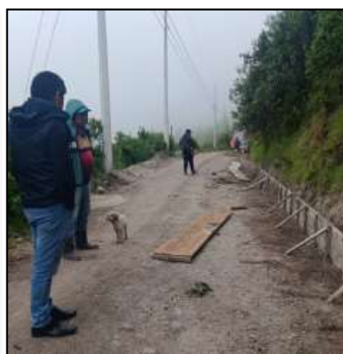
Fotografía 03: Adoquinado en la Comunidad San Martín