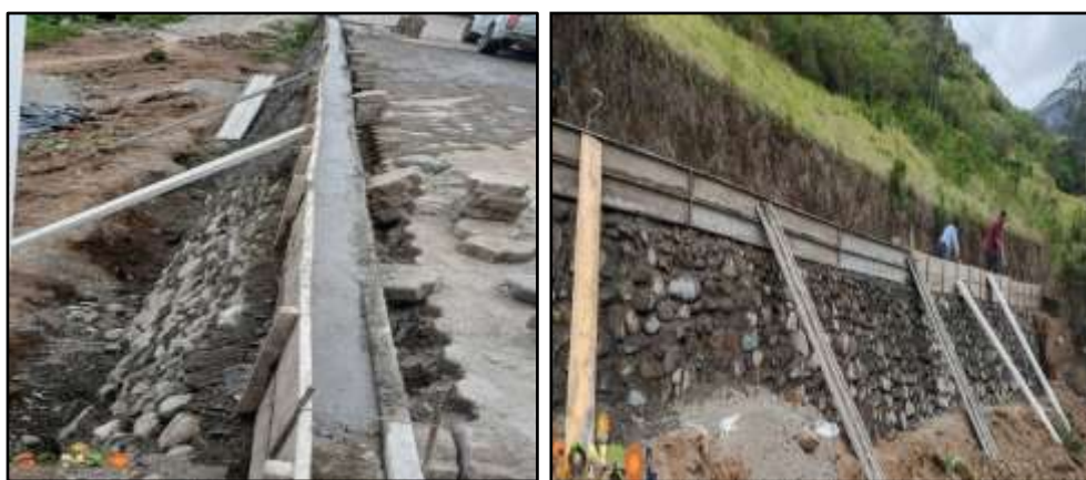
Fotografía 05: Construcción del muro ciclópeo