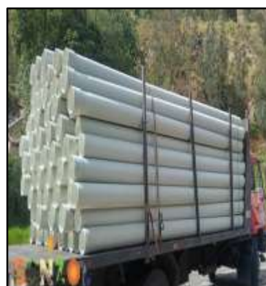
Fotografía 06: Alcantarillado en la Comunidad de Zúnag

En el Sistema Asentamientos Humanos del GADPR Gonzol se ha invertido un monto global de USD $34.770,44