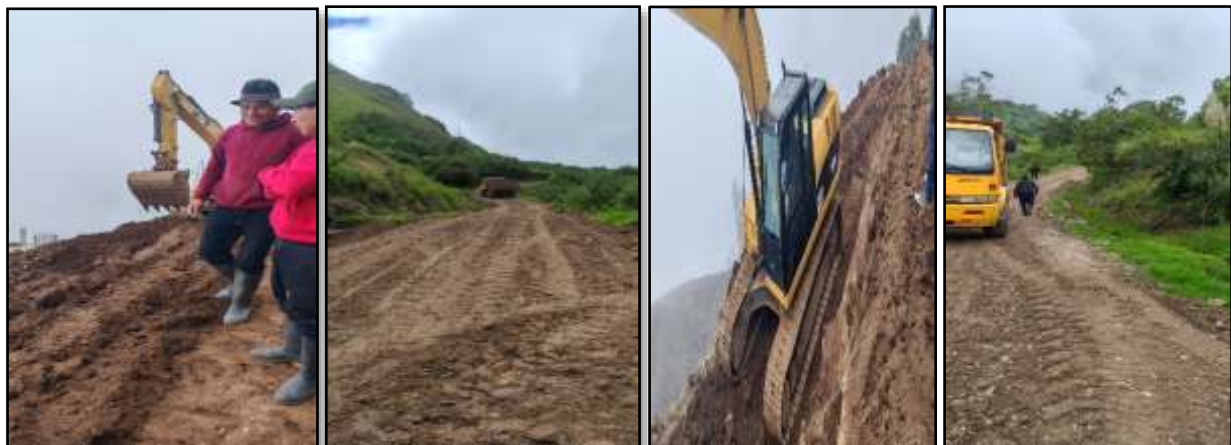
Fotografía 04: Mantenimiento vial preventivo y correctivo comunidad Iltús