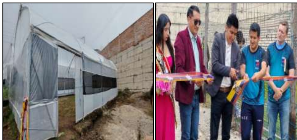
Fotografía 09: Invernadero Educativo

En el sistema Sociocultural- grupos de atención prioritaria y espacios públicos se ha invertido un monto global de $10.701,01 .